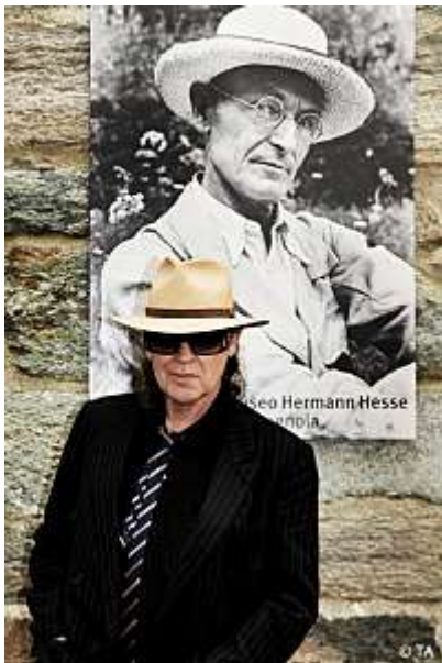
Udo L. besucht H. Hesse in Montagnola